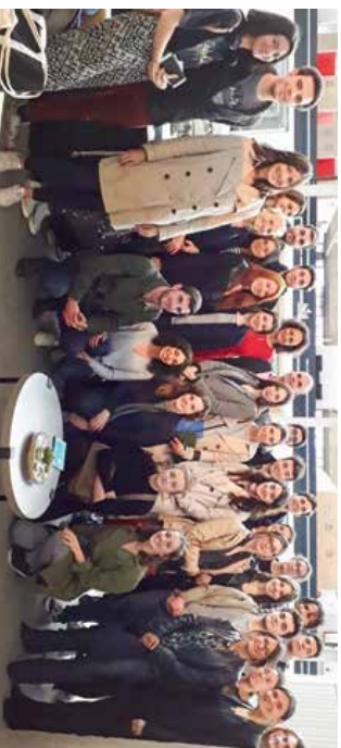
La première promotion de DU Droit et Technologies du Numérique.

Et nous appelons tous les doctorants de l'université Paris II qui travaillent sur ces thématiques à nous rejoindre, pour nous proposer des interventions ou nous accompagner dans les visites que nous ferons, cette année encore, auprès de professionnels majeurs du domaine. Cette interactivité entre les étudiants, doctorants et les professionnels qui peuvent suivre cette formation au titre de la formation continue, est essentielle. Le domaine du numérique est en train de se construire et il se construit avec la jeunesse. » ■