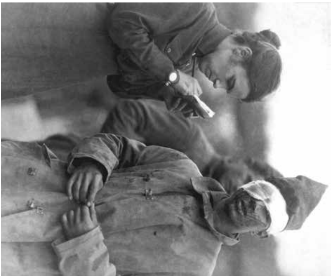
Cuère 1914-1918. Femme membre de l'Armée du Salut écrivant une lettre dictée par un soldat blessé.

@AssasParisII @UniversiteParis2PanthéonAssas AssasWebTV Université Panthéon Assas (Paris II) @universiteparis2pantheonassas